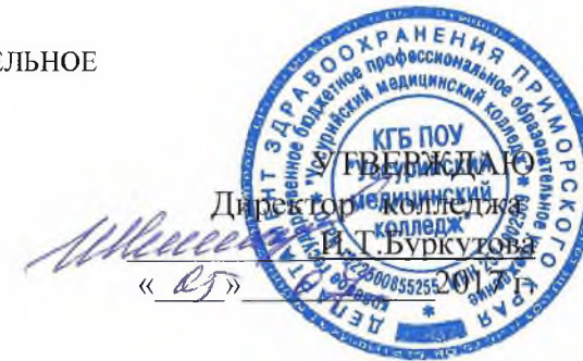
График проведения мероприятий внутриколледжного контроля менеджера (специалиста СМК) на 2017-2018 учебный год